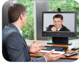
Personal Telepresence 1700

Garantisce un'esperienza di telepresenza istantanea e immersiva, adeguata a uffici direzionali o a sale riunioni di fascia alta – sempre disponibile ogni qualvolta serva.